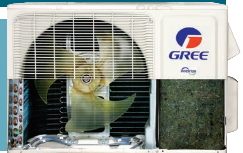
base avec élément chauffant

GREE équipe l'unité extérieure de l'Extreme d'une base avec élément chauffant qui empêche le gel de condensat et assure la pleine efficacité de l'appareil et une puissance de chauffage maximale.